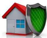
Locuința tip A

Prima de asigurare și suma asigurată prin polița obligatorie PAD depind de tipul locuinței: